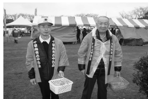
11月9日 いちほら大収穫祭

ご承知の通り、令和7年1月より、申告書等の控えに『収受日付印』の押なつが行われなくなりました。 申告書等をe-Taxにより提出した場合は、メッセージボックスから送信日時や申告内容を確認、プリントすることができますのでe-Tax送信をおすすめします。 【詳細は国税庁のホームページをご覧ください】 申告者ご本人のマイナンバーカードと設定した暗証番号(4桁の数字や6桁以上の英数字)をご用意 いただければ、確定申告時期に千葉南青色申告会からe-Taxで申告をする事ができます。 分離課税の申告のある場合など、青色申告会からのe-Tax送信のサポートができない場合が ございますので、詳細はお問合せ下さい。