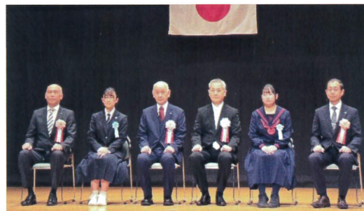
納税表彰式の様子