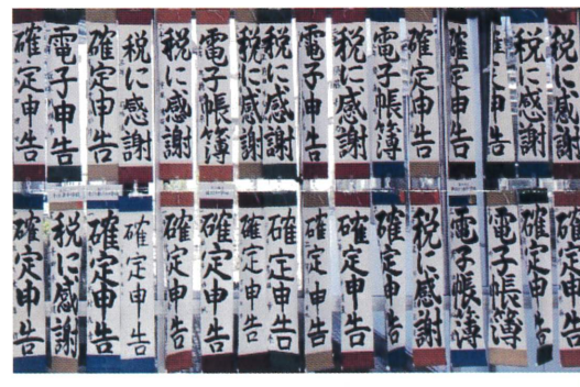
松戸市役所展示作品