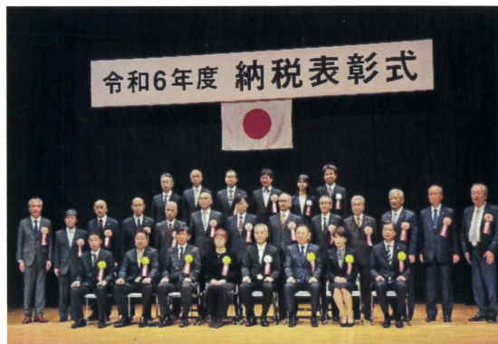
松戸税務署長表彰受賞の皆様