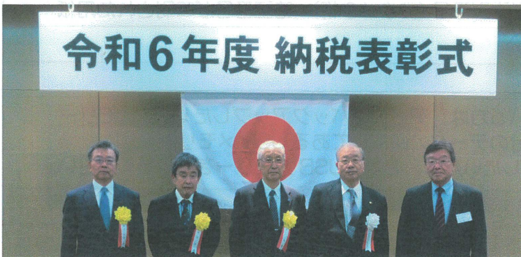
受彰された皆様、おめでとうございます。